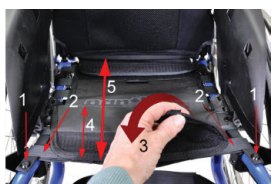
Adâncimea șezutului (tapișeriei scaunului)

Dispozitivele anti-răsturnare sunt un element de siguranță conceput pentru a preveni căderea pe spate în scaunul rulant. Dacă ai cea mai mică îndoială în privința echilibrului scaunului rulant, dispozitivele anti-răsturnare trebuie să fie întotdeauna complet extinse. Dacă folosești sau manevrezi scaunul într-un mod care face ca aceste dispozitive să fie utilizate frecvent, sau dacă modelul tău este echipat cu roți acționate electric, sarcina pe dispozitive va crește și trebuie verificate zilnic.