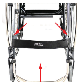
Înălțimea suportului pentru picioare