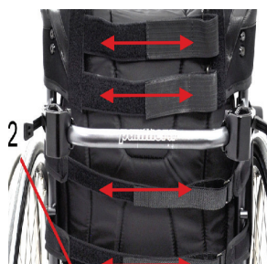
Tensiunea tapiteriei spătarului