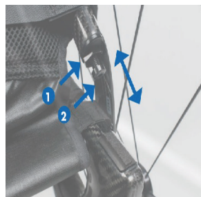
Unghiul spătarului reglabil