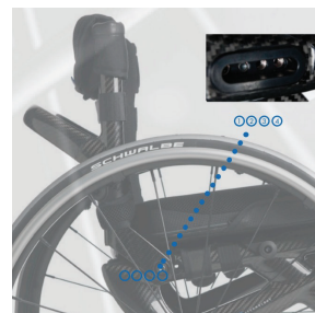
Echilibrul scaunului rulant reglabil