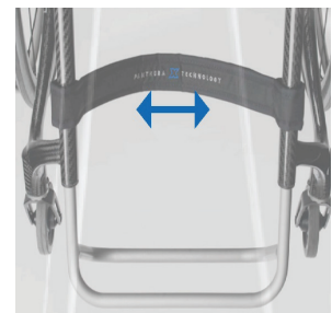
Ajustarea tensiunii bretelei pentru gambe