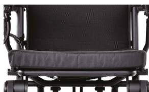
Perne din spumă respirabilă

Când este pliat, Q50 R este atât de compact încât poate fi depozitat cu ușurință în pridvor, sub scară sau chiar în portbagajul unei mașini. Datorită sistemului anti-răsturnare din spate, poate fi mutat cu ușurință și atunci când este în poziție verticală.