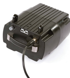
Baterie litiu-ion detașabilă