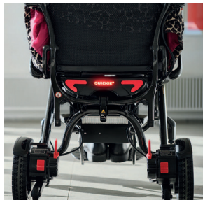
Lumină de zi