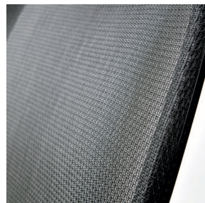
Spătarul de greutate ultra redusă